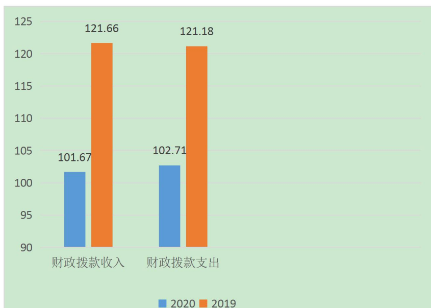
图 3：财政拨款收支与 2019 年度决算对比情况